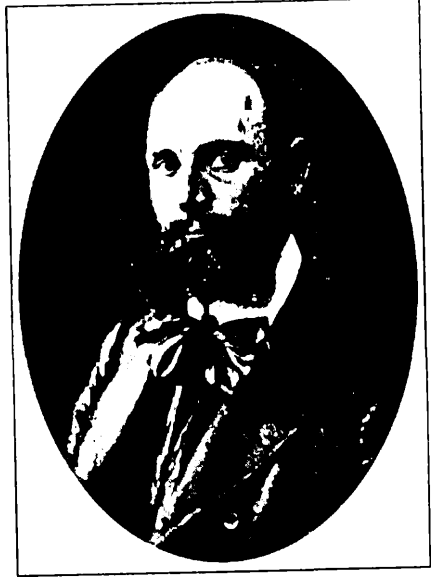
Ayaklanmadan sonra Federal Parti'yi kuran örgütün önderi Jan Sandanski

Bu hava içinde 1 Mayıs 1903'te Sımlevo Köyü'nde İç Devrimci Örgütün karar toplantısını yaptı. Bölge komitelerinin başkanları arasında önemli bir bölümü ayaklanmanın başlatılmasına karşı çıktı. Ayaklanma kararı Damian Gruyev'in ağırlığını koymasına üzerine alınır. Ayaklanma hazırlığı en gelişmiş durumda olan Manastır bölgesinde başlatılacaktır. Manastır 12 alt bölgeye ayrılır. Ayaklanmanın kumando heyeti olarak Damian Gruyev, Boris Saravof ve Anastas Lozançev eşit yetkilelerle seçilirler. Ayaklanma sırasındaki görev ve yetkileri belirleyen bir nizamname hazırlanır. Ayaklanma 30-40 kişilik çete gruplarıyla yürütülecek, tüm halkın harekete geçirilmesine gidilmeyecektir. Ayaklanma sırasında saldırılar askeri hedeflere yöneltilen, Müslüman-Türk halka saldırılmayacaktır. Bu ayaklanmanın bir dış müdahaleyi başlatacağı umulmaktadır.