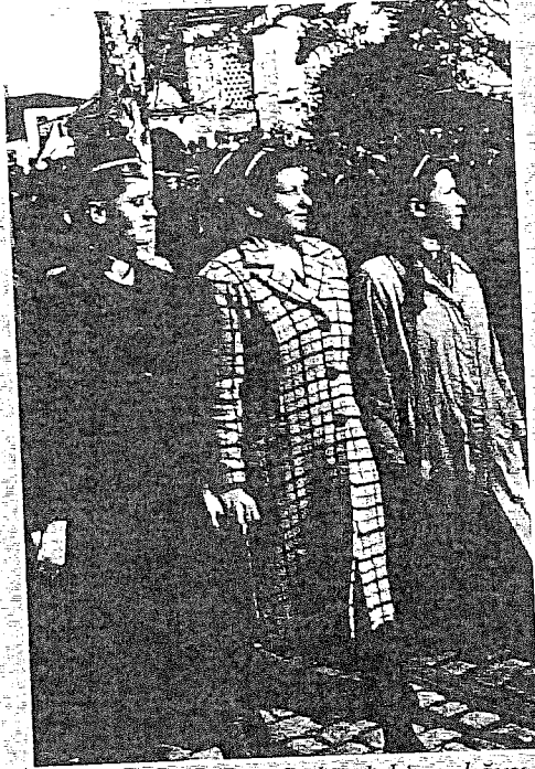
Kadınların kamusal alandaki varlığını meşrulaştıran Kemalist devlet feminizmi, bu varoluşu, belirli görevleri (başta "iyi" annelik) vurgulayarak ve cinsiyetsiz bir kimliğe zorlayarak ataerkil bir kayıt altına almıştır.

Bu örnekler ve 22 Nisan 1925 tarihli 'Ticaret ve Sanayi Odaları Hakkında Kanun' ve 27 Eylül 1925 tarihli 'Ticaret ve Sanayi Odaları Nizamnamesi' ile Türkiye'deki bütün ticaret ve sanayi odalarının özerkliklerine son verilerek devlete bağlı birer kurum olarak çalıştırılmaya başlanması, Türkiye'de genellikle 'devletçilik' olarak adlandırılan korporatist iktisat politikalarının 1930'lu yıllardan çok önce uygulamaya konulduğunun birer kanıtıdır. Kısaca, 1923 yılında Cumhuriyet'in ilanı ile birlikte, daha Cumhuriyet ilan