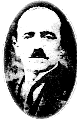
Yusuf Kemal Bey