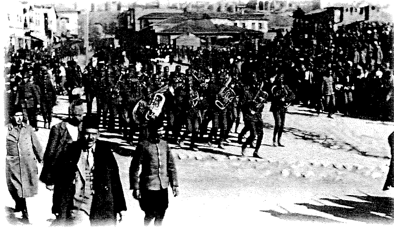
Ankara’da Zafer Dolayısıyla Tören

Türkiye’de olması gereken parti sistemi konusunda da, Kemalistlerin tek parti sistemine ısrarlı bir şekilde karşı çıkan mebuslar, partilerin liberal demokratik siyasal sistemin doğal olarak ayrılmaz parçası olduğu fikrini ileri sürmüşlerdir. Kemalistlerin, hem Türkiye’nin yakın tarihte başına gelen felâketlerin sorumlusunun 1908 sonrası dönemdeki particilik olduğu, hem de Türkiye’de parti olmadığı gibi dile getirdikleri birbiriyle çelişkili iddiaları kesinlikle reddeden mebuslar, Kemalistlerin bir yandan