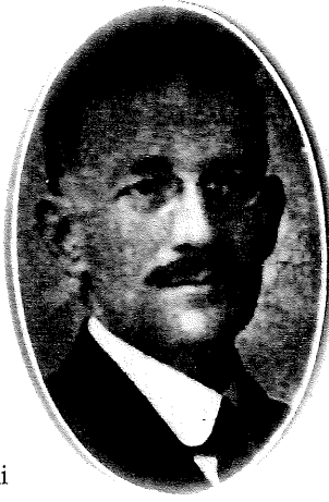
Mazhar Müfid Bey

Tüm bu bahsi geçen meşruiyet sorununa rağmen, Kemalistler, Büyük Millet Meclisi'nin 23 Nisan 1920'de Ankara'da toplanışının hemen sonrasında meclise sundukları hükümet şekli modeli ile, konumlarını tehlikeye attılar. 24 Nisan'da bakanların seçilmesi ve hükümetin kurulması ile ilgili olarak meclise 'Teşkilât-ı Hükümet Hakkında Teklif' sunan Atatürk, yaptığı konuşmada, meclisin yürütme işini doğrudan kendisinin yapamayacağı noktasından hareketle, içlerinden bir heyeti bu işi yapmaya memur etmesinin, bu heyete de Meclis Reisi'nin –yani, bir gün önce bu makama seçilmiş olan kendisinin– başkanlık yapmasının ve heyete başkanlık yapacak Meclis Reisi'nin meclis adına imza ve her türlü kararı tasdik etme yetkisine sahip ve yürütmeden sorumlu olmasının gerekli olduğunu söyledi. (11) Bu heyette görev alacak kimseler 'vekil' adını alacak ve bu heyete 'İcra Vekilleri Heyeti' adı verilecekti. Henüz ortada vekillerin nasıl seçileceğine dair bir kanun olmadığı için, 25 Nisan'da yapılan altı kişilik geçici icra encümeni seçiminde Atatürk'ün aday göstermesini teklif eden Kemalist Refik [Koraltan]'ın önerisi mebuslarca protesto edildi. (12) Meclis, daha ilk günden başlayarak, yalnızca yasama erkini değil, yürütme erkini de elinde tutmak istediğini böylece göstermiş oluyordu. Daha doğrusu, meclis bu davranışıyla ilk günden başlayarak, Büyük Millet Meclisi'nin meclisin üstünlüğü prensibini ısrarlı bir şekilde savunacağını kamuoyuna ilân etmiş bulunuyordu.